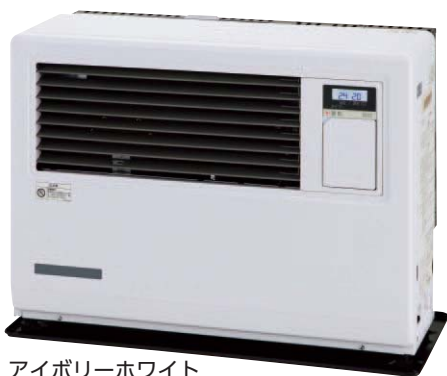
アイボリーホワイト