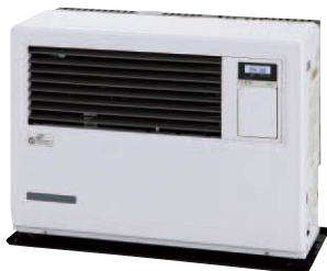
アイボリーホワイト