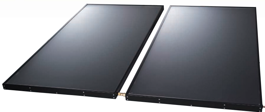
太陽熱利用給湯システム エネワイターシリーズ