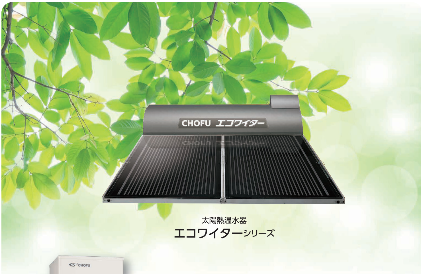
太陽熱温水器 エコワイターシリーズ